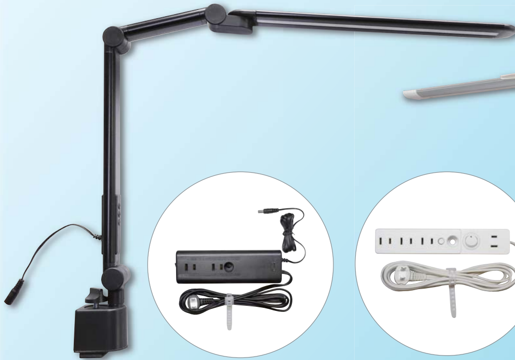
コンセントボックス