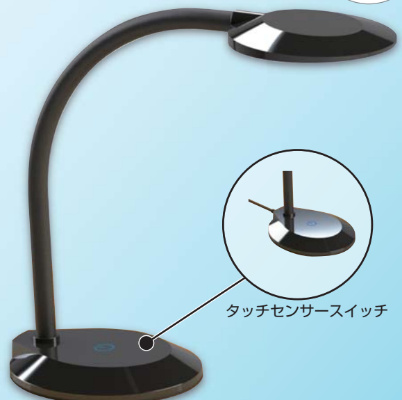
タッチセンサースイッチ