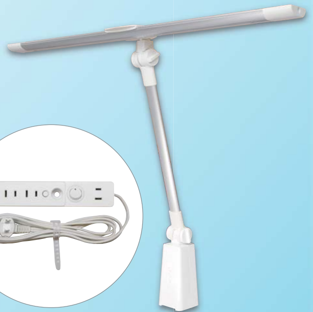
コンセントボックス