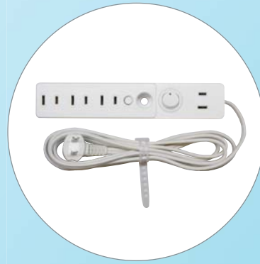
コンセントボックス