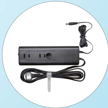
コンセントボックス